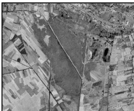
Humedales continentales – TIPO_0136: “/turbera”