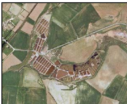
Humedales continentales – TIPO_0136: “/salina continental (por evaporación)”